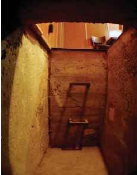
Tunel do tlačiarne