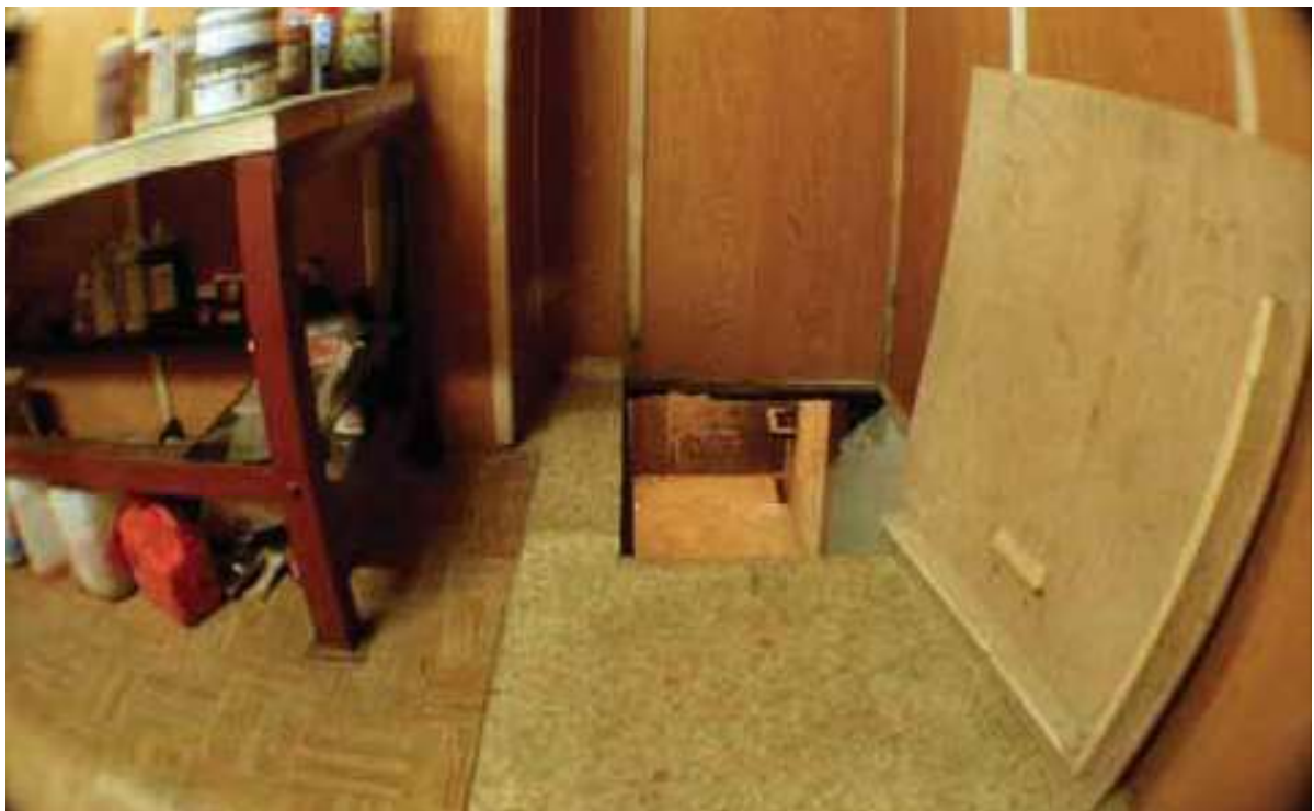
Výstup z tunela do tlačiarne