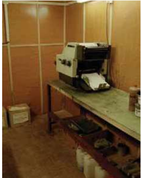
Prepašovaný ofsetový stroj